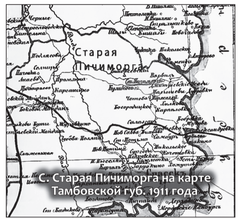
С. Старая Пичиморга на карте Тамбовской губ. 1911 года