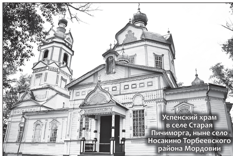
Успенский храм в селе Старая Пичиморга, ныне село Носакино Торбеевского района Мордовии

«Пели громко, прямо кричали. Напевы держались древние, протяжные, напоминали голос ветра, гулявшего по обширному Саровскому лесу».