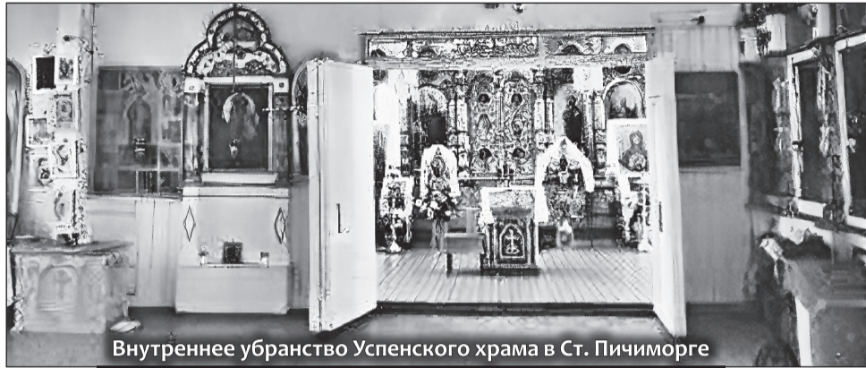
Внутреннее убранство Успенского храма в Ст. Пичиморге

Недавно мы рассказывали о саровском иеромонахе Василии (Эрекаеве), прославленном в 2000 году в лике преподобномучеников (№ 17 (186) от 17.10.2019). А сегодня, благодаря сохранившимся архивным документам, возвращается из забвения имя его односельчанина, иеромонаха Саровского монастыря Петра (Эрзина) (08.06.1886 (по ст. ст.) — 9.11.1942). Этому мордовскому мальчику из крестьянской семьи предстояла трудная жизнь, монашеский подвиг, смерть за веру Христову в таежной вятской глуши, упокоение в безвестной могиле на лагерном кладбище.