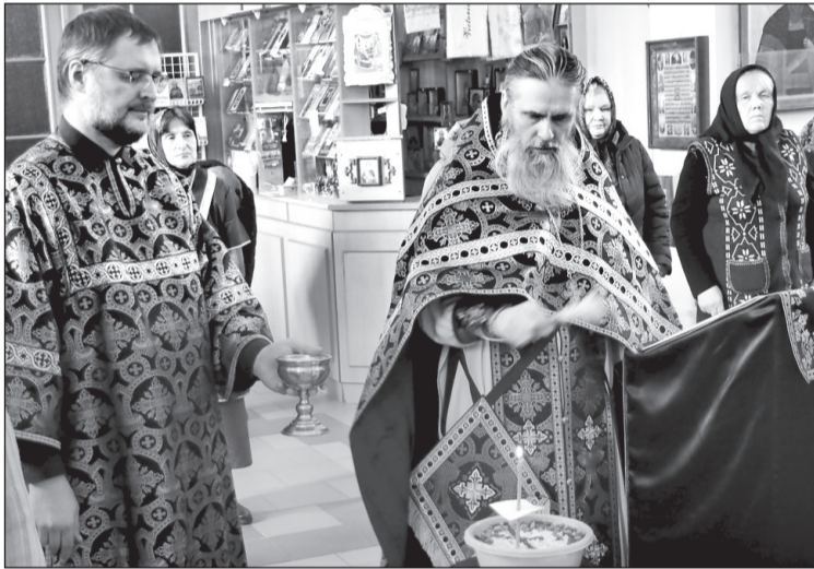
В пятницу, 6 марта, после литургии Преждеосвященных Даров состоялось освящение коливо в память о св. вмч. Феодоре Тироне.