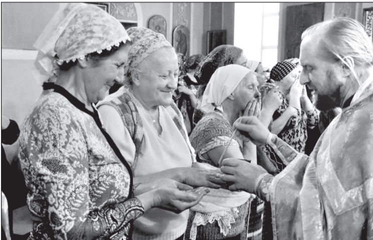
Великим постом в приходских храмах проводится общее соборование верующих. Во время Таинства Соборования прихожане молятся о том, чтобы Господь исцелил их от болезней и простил забытые грехи. Фото из храма Всех Святых, 15 марта.