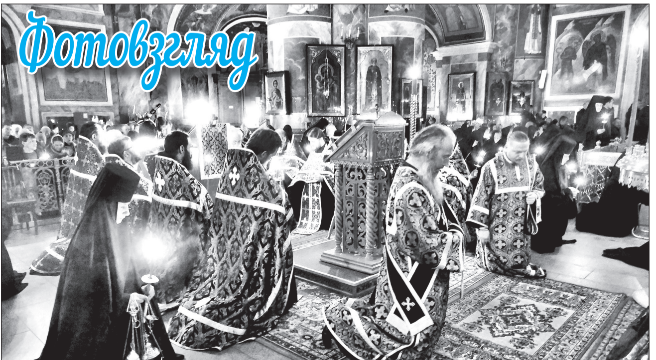
15 марта в Серафимо-Дивеевском монастыре состоялась первая пассия. Так называется особая служба, которая совершается вечером четырех воскресных дней Великого поста. Чинопоследование служит перед Распятием, вынесенным на середину храма. Пассия помогает верующим настроиться на духовный подвиг, достойно подготавливаясь к встрече Светлого Христова Воскресения.