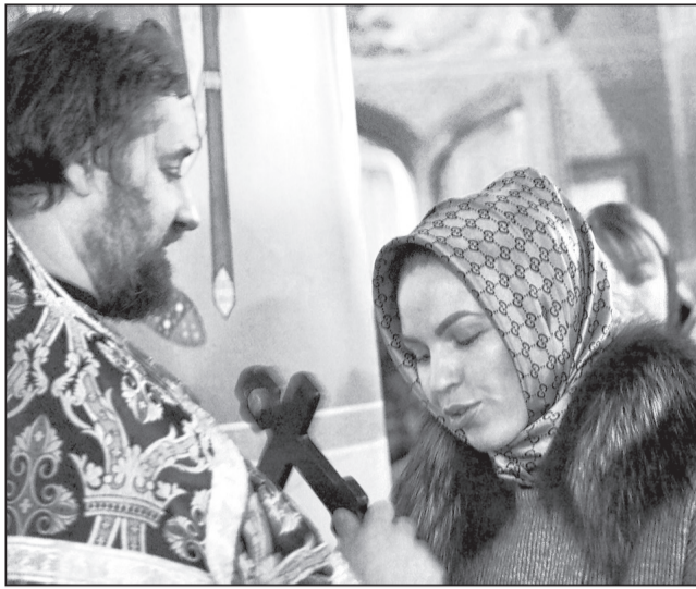
Чин прощения в храме в честь святых Царственных страстотерпцев, 1 марта.

Таким образом, Христос — второй Адам, одержав победу над диаволом, забирает у него власть над родом человеческим, который подпал под нее после грехопадения. Все, что Христос делал, живя во плоти, Он делал для нас, научая нас Истине.