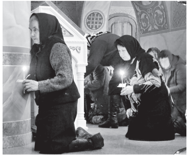
В первые четыре дня Великого поста, со 2 по 5 марта, во всех храмах совершали Великое повечерие с чтением покаянного канона прп. Андрея Критского и коленопреклоненными молитвами.