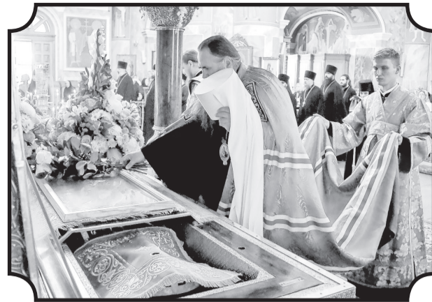
10 августа в Дивеевском монастыре митрополит Георгий возглавил празднование иконе Божией Матери «Умиление» Серафимо-Дивеевской. Это была келейная икона прп. Серафима, перед которой он преставился. Святыню сберегли в советское время, и сейчас она находится в Патриаршей резиденции в Чистом переулке. Раз в году на праздник Похвалы Пресвятой Богородицы ее приносят в Богоявленский Елоховский собор на патриаршее богослужение.