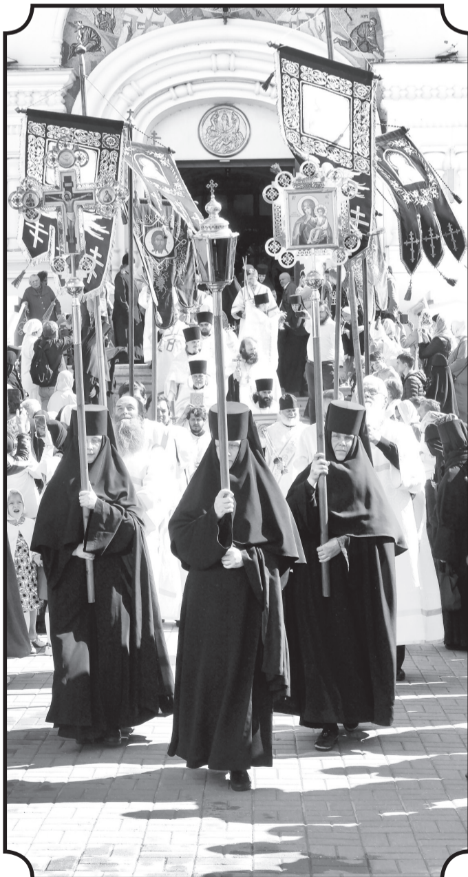
«Величай, душе моя, на Фаворе преобразившегося Господа...» В престольный праздник Преображения Господня в Дивеевской обители после поздней литургии прошел крестный ход по Святой Канавке. Во всех храмах совершали чин освящения плодов — отсюда народное название праздника Преображения «Яблочный Спас».