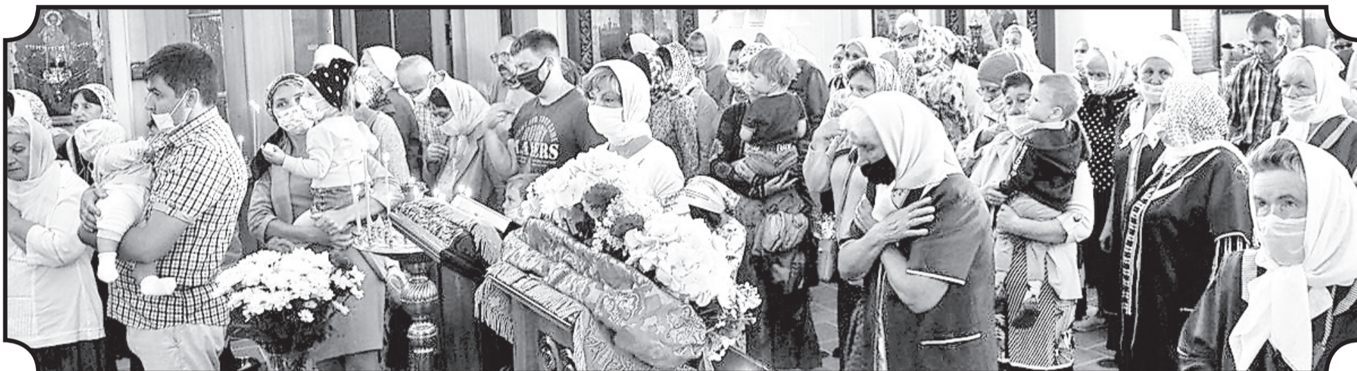
2 августа отметили престольный праздник в саровском храме в честь Илии Пророка, а 9 августа — в храме в честь св. вмч. и целителя Пантелеимона в Больничном городке.