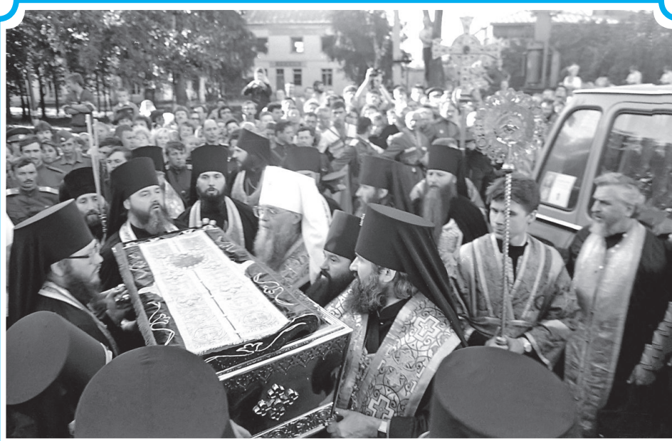
30 июля 1991 года в Дивеевский монастырь прибыл крестный ход со святыми мощами прп. Серафима Саровского. На праздничные богослужения собралось около 10 тысяч паломников.

Для доставки мощей преподобного в Москву был выделен специальный вагон поезда. Когда процессия с крестным ходом подошла на вокзал, мы увидели, что все перроны и подходы к зданию вок-