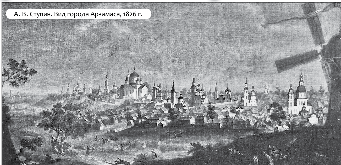
А. В. Ступин. Вид города Арзамаса, 1826 г.

Картина была на подрамнике в мастерской — нежилой комнате, где художник работал, там же хранились его законченные работы. Высокий мольберт, большая каменная плита с курантом (каменным пестиком для растирания красок), палитра, кисти... Ночью в дом пробрались похитители. Они выставили оконную раму, срезали