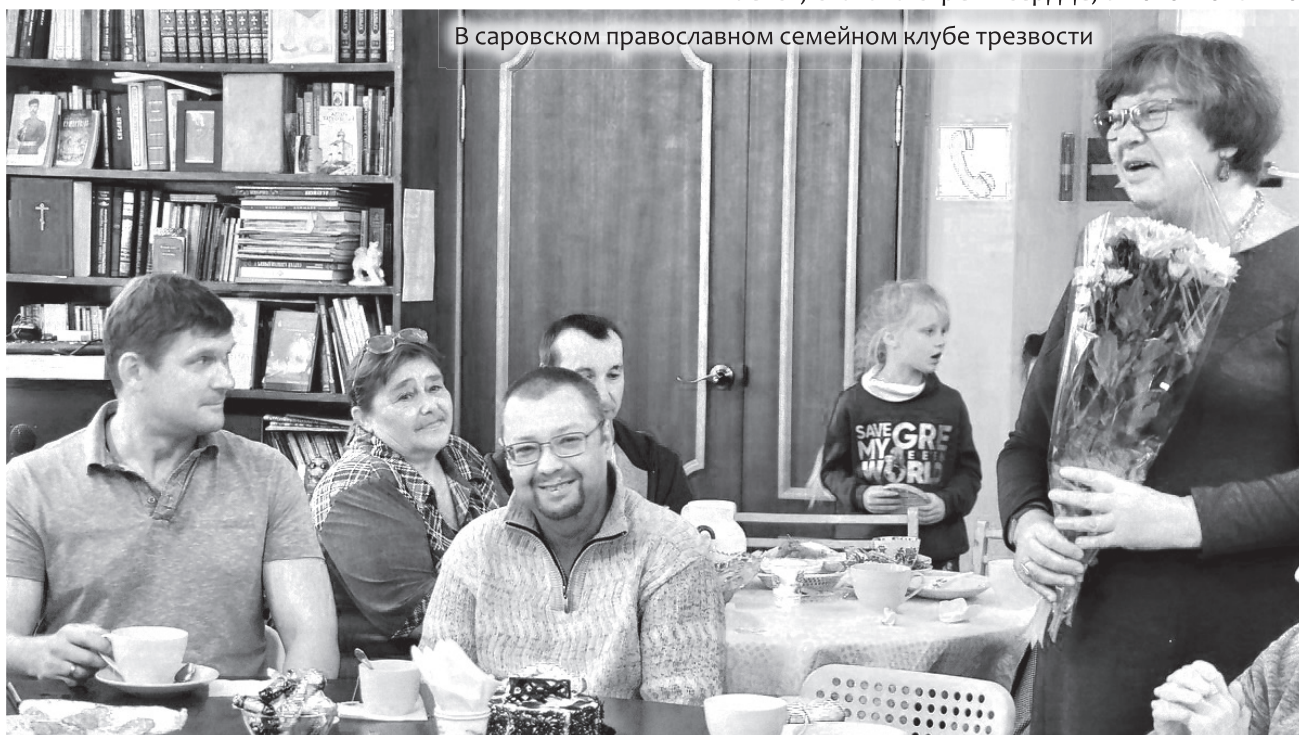
В саровском православном семейном клубе трезвости

И это обязательно даст свои плоды в свое время. Это время у каждого свое, кто-то раньше, кто-то позже... Надо набраться терпения.