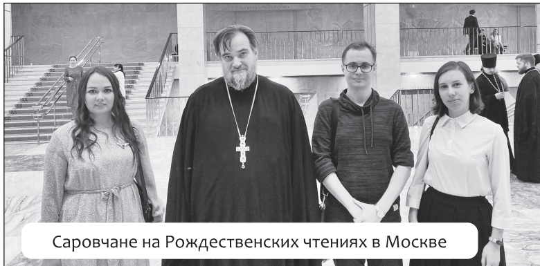
Саровчане на Рождественских чтениях в Москве