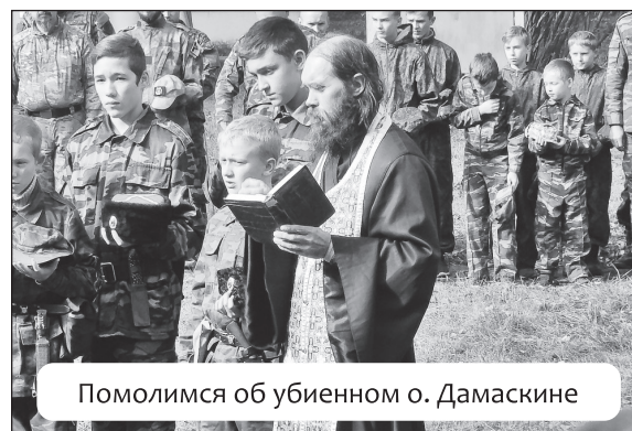
Помолимся об убиенном о. Дамаскине