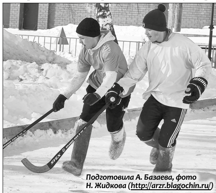
Подготовила А. Базаева

19 февраля в селе Красное Арзамасского района провели IV епархиальный открытый турнир по хоккею с мячом в валенках, посвященный Дню защитника Отечества. Соревновались шесть команд из Нижегородской области. Наш город представляли две команды: «Саров» и «За жизнь». Для саровчан это был первый опыт, поэтому до призовых мест они не дошли.