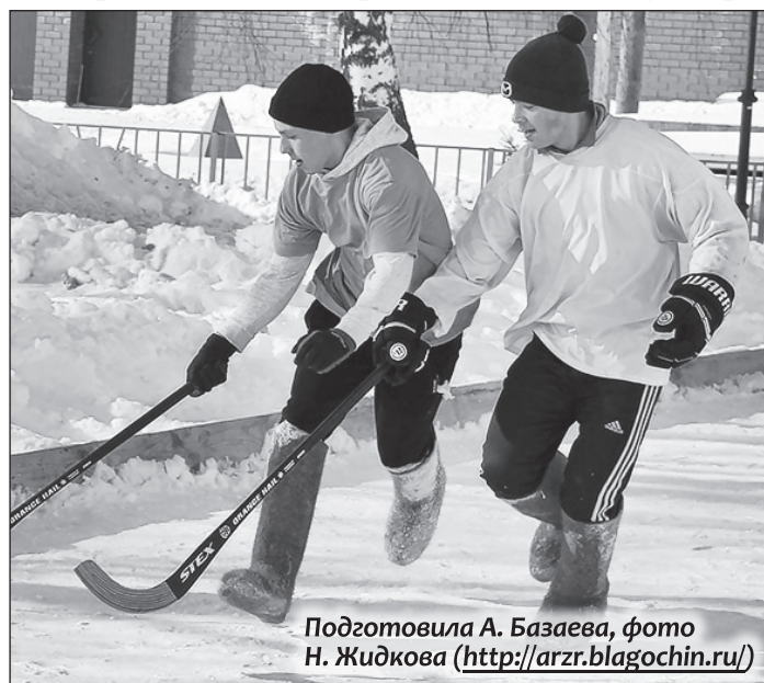
Подготовила А. Базаева

19 февраля в селе Красное Арзамасского района провели IV епархиальный открытый турнир по хоккею с мячом в валенках, посвященный Дню защитника Отечества. Соревновались шесть команд из Нижегородской области. Наш город представляли две команды: «Саров» и «За жизнь». Для саровчан это был первый опыт, поэтому до призовых мест они не дошли.