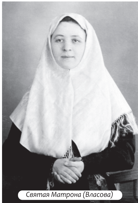
Святая Матрона (Власова)